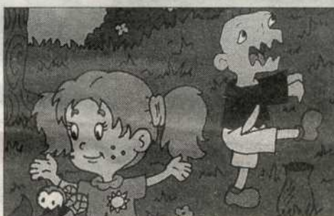
Дети ели мед и лили молоко, уживались за ульями, читали добрые умные книжки. На пасеке все они чувствовали себя лучше. Но до конца не вылечились никто. Время от времени болезнь вспыхивала с новой силой. Тогда симпатичные лица ребят превращались в страшные рожи, руки — в железные крючья, и они принимались крушить все вокруг себя.

Нет сомнения в том, что этот материал создан в расчете на маленького читателя: сюсюкающий текст под примитивными картинками, сказочный сюжет, построенный на знакомых любому ребенку образах. История повествует о мальчике Пете, которой заболел страшной болезнью — телеманией. После просмотра очередного ужастика или боевика Петя на несколько часов превращался в ходячий скелет или в жестокого робота-убийцу. «Ни врачи, ни экстрасенсы не смогли помочь Пете. Родители уже потеряли надежду, но вот кто-то рассказал им о мудром старике-пасечнике, лечащем народными средствами» — занудно вещают авторы. Как оказалось, у этого пасечника уже находились несколько детей с похожими симптомами. На пасеке им становилось лучше, но, как повествует текст комикса, «до конца не вылечился никто. Время от времени болезнь вспыхивала с новой силой. Тогда симпатичные лица ребят превращались в страшные рожи,