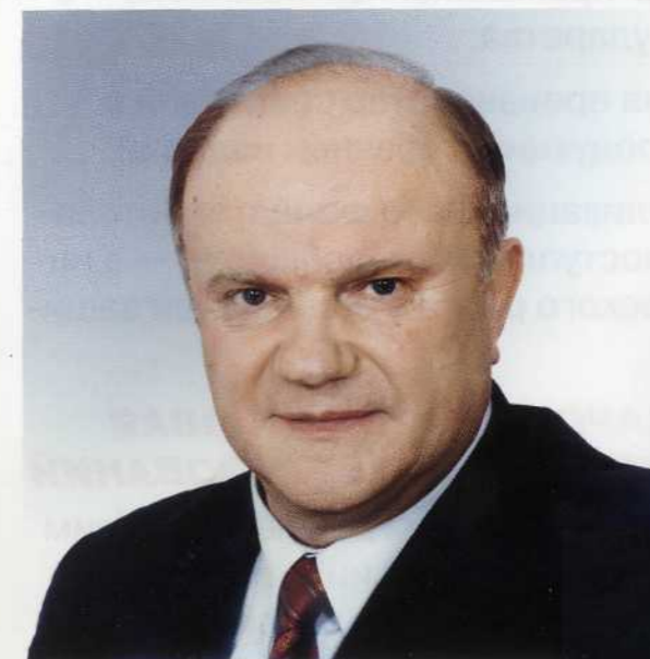
Геннадий ЗЮГАНОВ, политик, лидер КПРФ

КОММУНИСТИЧЕСКАЯ ПАРТИЯ РОССИЙСКОЙ ФЕДЕРАЦИИ