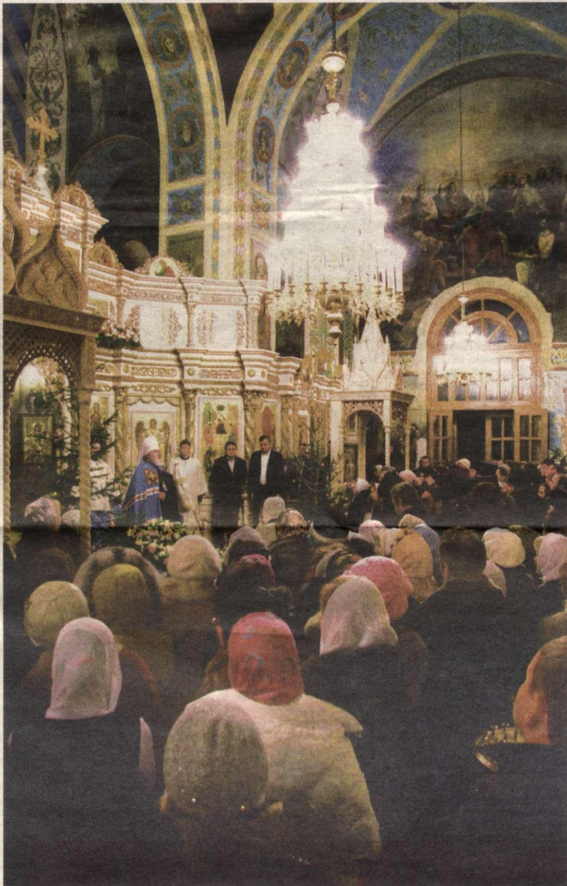
Служба в Свято-Троицком кафедральном соборе