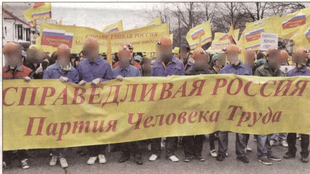
Положения программы партии СПРАВЕДЛИВАЯ РОССИЯ будут реализованы не иначе чем на основании федеральных законов в целях достижения социальной справедливости