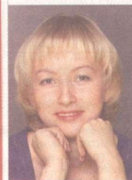
Кандидат в депутаты Заксобрания Пермского края

Свои предложения, пожелания и материалы направляйте: permkprf@yandex.ru