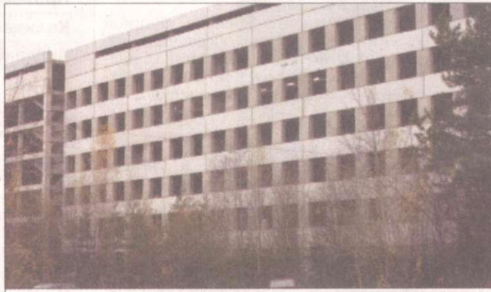
Недостроенный корпус больницы в Добрянке был продан за бесценок

и надеждой... В конце 80-х годов нам начали строить новый больничный комплекс, в который должны были переехать все отделения нашей больницы. Предполагалось, что мы сможем существенно увеличить количество мест в стационаре, оснастить операционные и процедурные кабинеты по последнему слову техники. Однако с распадом Советского Союза строительство прекратилось, а недавно недостроенный комплекс за бесценок был продан вместе с землёй местному богачу. Сей-