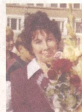
Кандидат в депутаты Заксобрания Пермского края