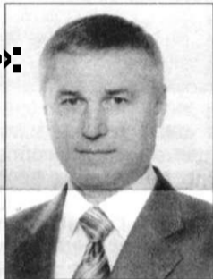
Кандидат в депутаты Заксобрания Пермского края

Принятие закона Пермского края, передающего долевого строительство под контроль государства.