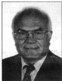
Кандидат в депутаты Заксобрания Пермского края