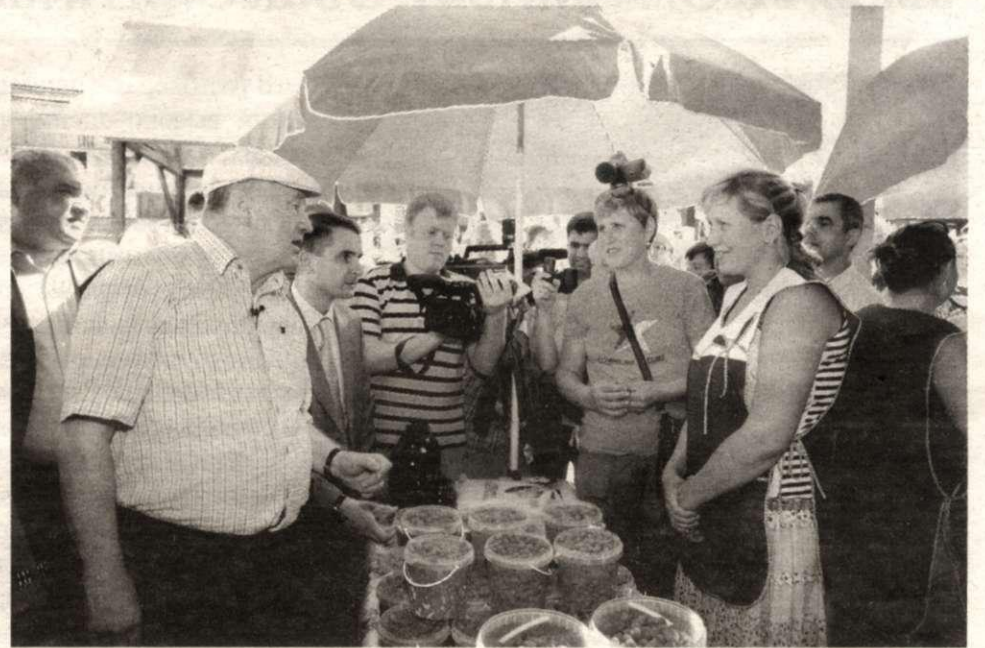
Пермская малина - Вольфыча манила

— Похожее состояние дел по всей России, — провел параллель лидер ЛДПР. — Если действующая власть не в состоянии навести порядок в собственном доме, значит ее надо менять. Иначе не вылезти из ямы.