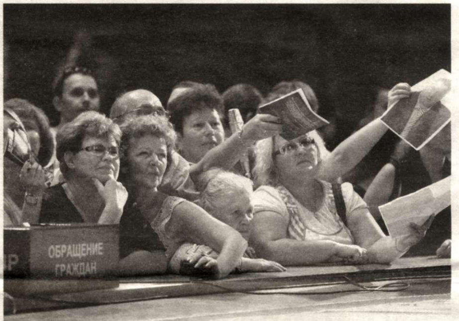
Лидер ЛДПР получил сотни наказов пермяков