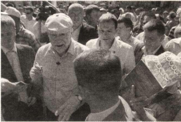
Жириновский слушает и слышит людей

доверия. Им просто нечего предложить россиянам. Нынешняя власть оказалась даже не в состоянии распорядиться так называемыми «нефтяными» деньгами. Эти люди просто не хотят и не умеют работать. Значит, надо уступить место тем, кто в состоянии навести порядок.