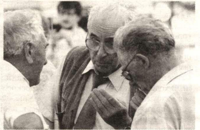
Перед органным залом идет бурное обсуждение программы Жириновского

По окончании полтора-рачасовой «официальной части» люди взяли Жириновского в живое кольцо. Звучали слова благодарности, наказы «Так держать!», многочисленные просьбы оказать посильную помощь. В том, что она последует, пермяки не сомневаются.