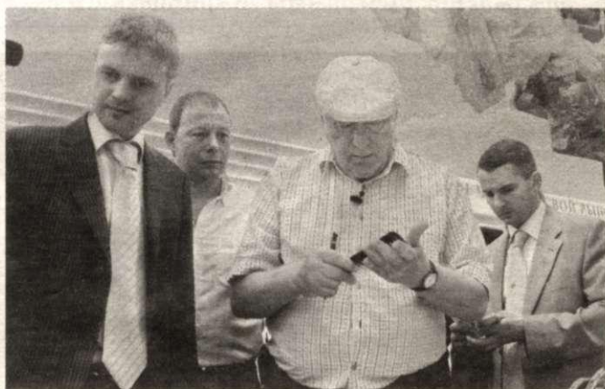
ВВЖ на нашем рынке