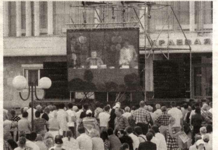
Выступление Жириновского транслировалось на улицах города