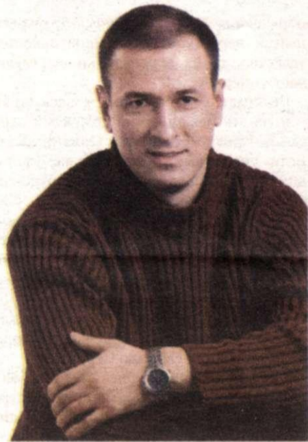
И здесь на этом перекрестке с любовью встретился своей.... (Из кинофильма «Весна на заречной улице»)