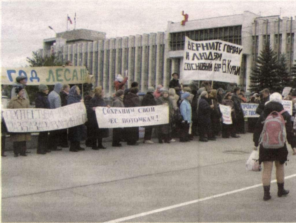
Митинг 5 октября 2011 года у здания Законодательного Собрания

5 октября у здания Законодательного Собрания состоялась акция протеста против захвата леса в Верхней Курье.