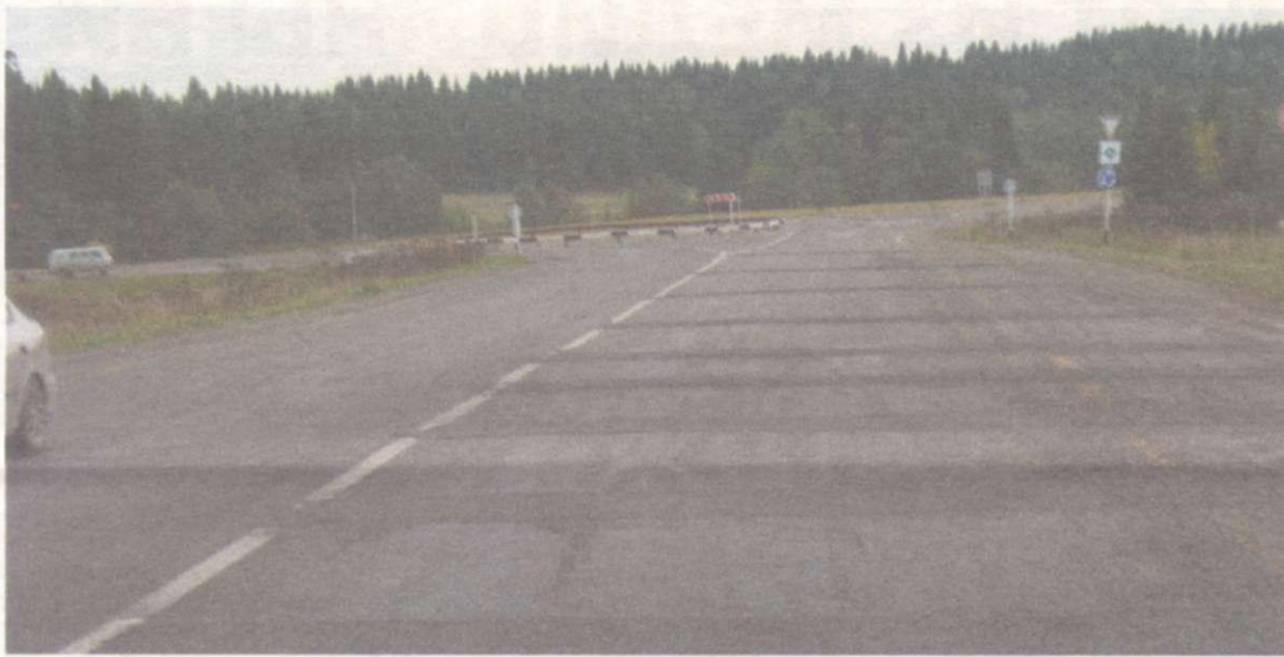
Дорога Пермь — Усть-Качка

«История началась еще летом. Мы обнаружили нарушения, допущенные при размещении государственного заказа на ремонт дороги Пермь - Усть-Качка. В частности, одним из условий получения заказа было наличие у подрядчика материалов определенной марки. Об этом факте нам сообщил подрядчик,