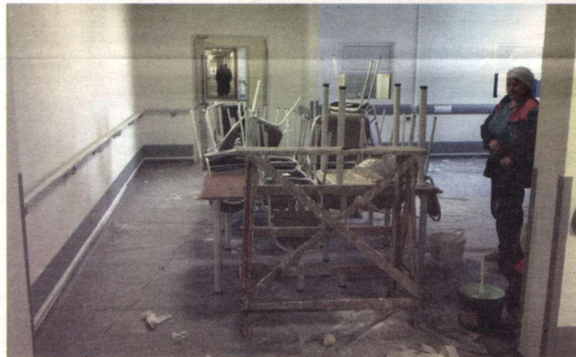
Здесь рожать нельзя