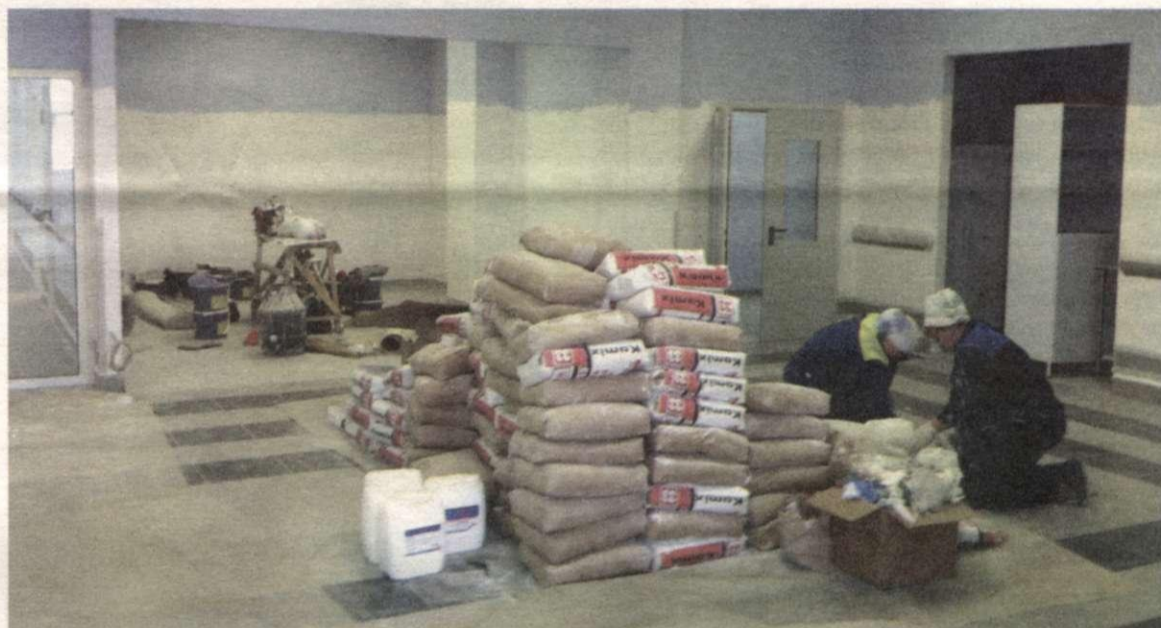
Москве говорят одно, а на деле — вот такая картина

зор о завершении строительства и начале сдачи объекта. По закону у Стройнадзора от 10 дней до месяца нормативный срок на принятие решения. На самом деле первичное заключение Стройнадзора уже подписывалось в начале сентября, в нем немалый перечень замечаний». Конец цитаты. Из сообщения непонятно, готов объект или нет. Ни официального открытия, ни победных сюжетов и статей о том, что объект сдан, даже в подконтрольных губернатору СМИ мы не увидели. В день пленарного заседания 20 октября депутаты узнали, что губернатор должен отчитаться о стройке перед премьером Путиным. Вполне логично, что и мы, представители законодательной власти, должны услышать отчет правительства Пермского края о ситуации на стратегически важном объекте. По инициативе группы «Солидарность» такой вопрос был внесен в повестку дня. К слову ска-