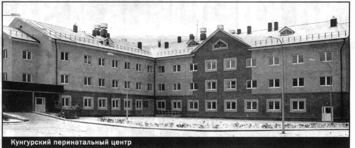
Кунгурский перинатальный центр

Однако первый проект перинатального центра, который инициировался прежним градоначальником, предусматривал строительство объекта из сэндвич-панелей. Что вызвало недоумение в среде строителей и медиков. Ведь что такое сэндвич-панели? Это металлический каркас с утеплителем внутри. Времянка, не более. Странным показалось и то, что перинаталь-