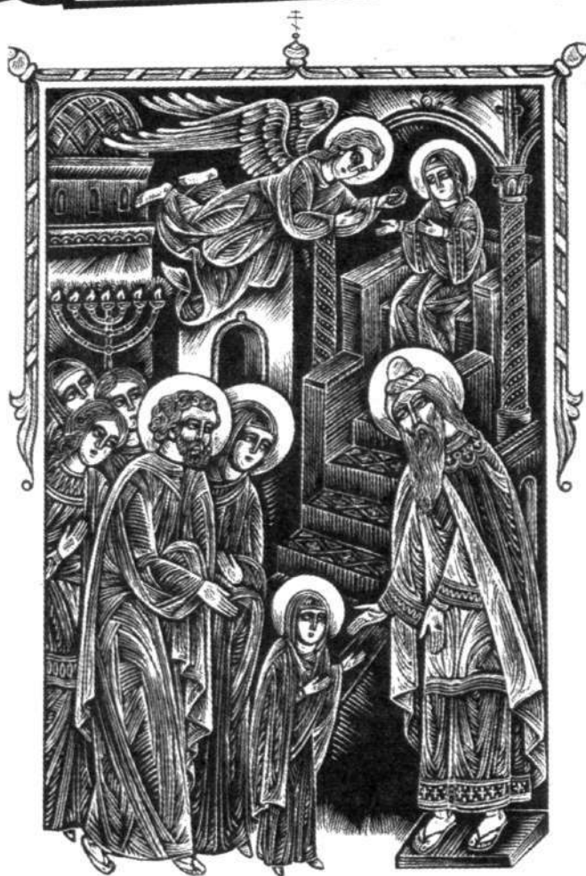
Введение во храм Пресвятой Богородицы

чеников пострадали за веру во Христа в 250 году при императоре Декии.