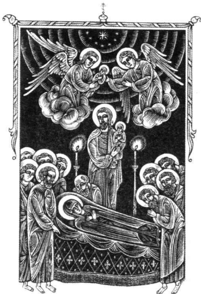
Успение Пресвятой Богородицы

С этого дня наблюдают за погодой в течение