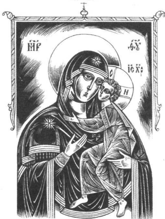
Пресвятая Владычица наша Богородица Приснодева Марня

АПОСТОЛ ИАКОВ, БРАТ ГОСПОДЕНЬ – сын праведного обручника Иосифа, был избран первым епископом Иерусалимской церкви.