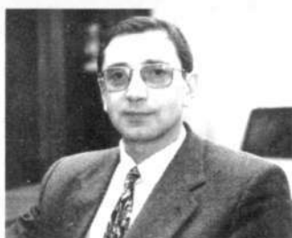
Н.Л.ЯШИН Заместитель главы г. Перми