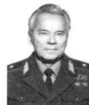
М.Т.КАЛАШНИКОВ, дважды Герой Социалисти- ческого труда, главный конструктор стрелкового оружия (Ижевск)