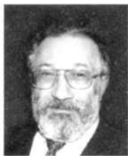
А.Н.ЧИЛИНГАРОВ, Герой Советского Союза, заместитель председателя Госдумы РФ