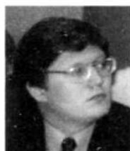
А.К.ИСАЕВ, секретарь Федерации независимых профсоюзов России