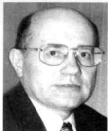
Ю.Г.МЕДВЕДЕВ, председатель Законодательного Собрания области (Пермь)