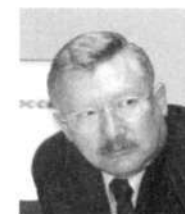
О.В.МОРОЗОВ, депутат Госдумы РФ, председатель депутатской группы «Российские регионы»