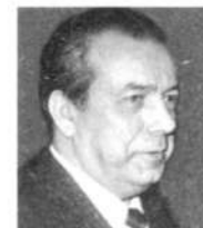
А.И.ВОЛЬСКИЙ, президент Российского союза промышленников и предпринимателей