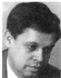
В.Г.СТЕПАНКОВ, депутат Государственной Думы РФ (Пермь)