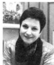
Е.Ф.ЛАХОВА, председатель Общероссийского общественно-политического движения женщин России