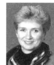
Е.В.КОНДАКОВА, Герой Российской Федерации, инструктор- космонавт - испытатель