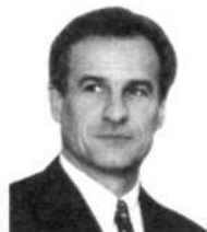
С.В.ЯСТРЖЕМБСКИЙ заместитель Премьера Правительства Москвы