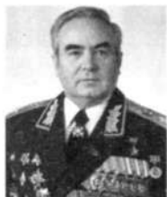
В.Г.КУЛИКОВ, Герой Советского Союза, Маршал Советского Союза