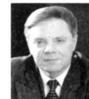
Б.В.ГРОМОВ, Герой Советского Союза, генерал-полковник