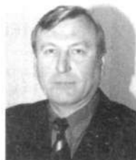
Г.П. ТУШНОЛОВОВ, Первый заместитель губернатора Пермской области