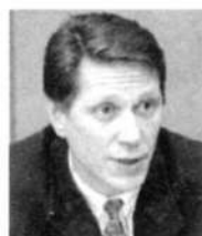
А.Д.ЖУКОВ, депутат Государственной Думы РФ