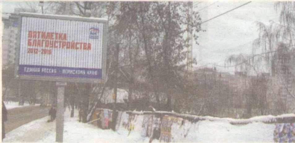
Болтовня о благоустройстве вместо реального благоустройства.

Пермяков мучили отвратительно-го качества капремонтом, после чего многомиллионные невыполненные государственные обязательства по его проведению попросту переложили на плечи населения. Теперь пермяки оплачивают акулам коммунального бизнеса услуги по